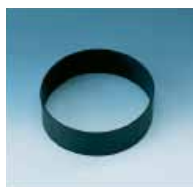
Flens med lav avsuging