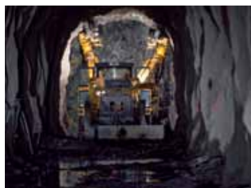
Gruvedrift og tunnelbygging