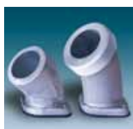
Avtapping (slange, BSP, NPT)